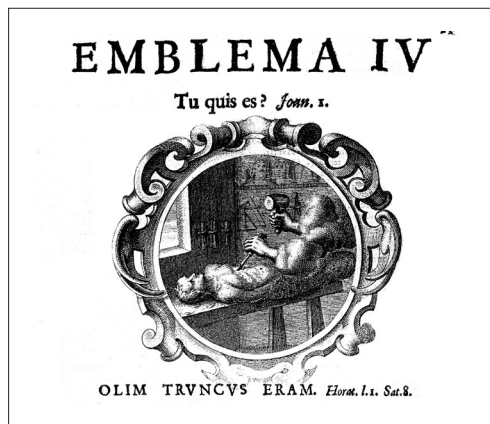
Fig. 3. Emblema IV. Henricus Engelgrave Lux evangelica sub velum Sacrorum Emblematum recondita in Anni Domenicas.

la ciencia es el conocimiento más relevante, en el que los hombres son elevados a la dignidad pero, recuerda, que los científicos se expresaron por una estatua formada de un tronco. Porque como todas las cosas tienen habilidad para sobresalir, todos los grandes conocimientos en filosofía, derecho, medicina, aritmética, música, astrología, teología, se desvanecerán como tontos en sus pensamientos, si los hombres no se convierten a Dios.