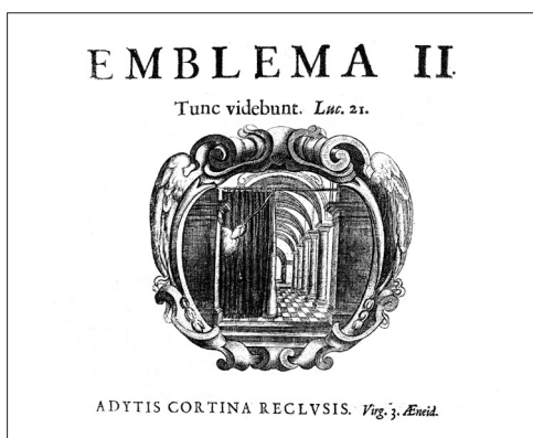
Fig. 1. Emblema II. Henricus Engelgrave Lux evangelica sub velum Sacrorum Emblematum recondita in Anni Domenicas .

Por otra parte, el mote está tomado de una cita de la Eneida de Virgilio: Adytis cortina reclusis . 2 Añadido al mote y a la referencia complementaria, en los emblemas del Lux evangelica se incluye una declaración de concepto 3 para ayudar al lector a clarificar la totalidad del mensaje. En el caso de este emblema la declaración dice: « Al final del juicio de Dios, en el que se muestran todos los tormentos y los grandes suplicios, el más grave será la manifestación de los crímenes ocultos y en el día de la revelación se abrirá la cortina: en búsqueda de la Luz de Jerusalén y toda desgracia será negada en el cielo, cualquiera que sea su vergüenza sometida a la oscuridad, y se debe manifestar ante el Tribunal de Justicia y Juez de los Mortales, con truenos y trompetas a todos los oídos: Por lo tanto, cuando